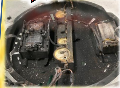
芳賀地区 2021年10月 発生事例

例えば、器具内の 安定器の絶縁劣化 により まれに 発煙・発火事故 に至る場合があります。 安全性の面からも早めに点検と交換を ご検討ください。