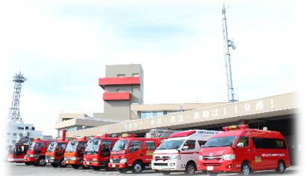
消防本部・真岡消防署