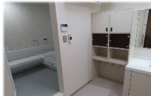
女性用浴室、洗面脱衣室の完備

・今後想定される大規模地震にも耐え得る構造とし、救命率の向上のため、ドクターヘリの着陸するスペースを整備しました。また、高齢者や障がいのある方も利用しやすいようバリアフリーとし、地域の防災拠点としての機能も兼ね備えています。 平成29年3月竣工