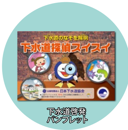
下水道啓発 パンフレット