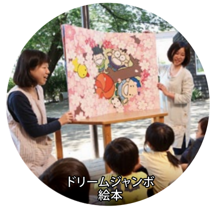
ドリームジャンボ 絵本