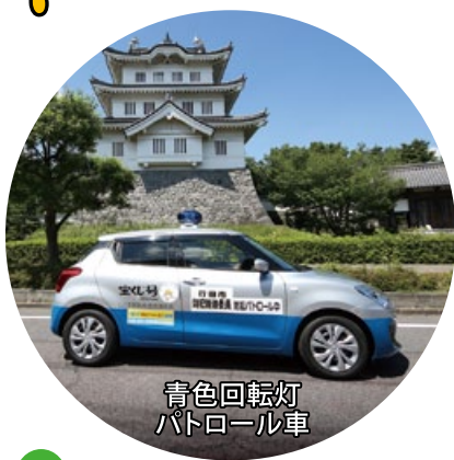
青色回転灯 パトロール車