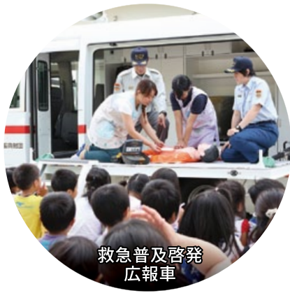
救急普及啓発 広報車

図書館や動物園、学校や公園の整備をはじめ、少子高齢化対策や災害に強い街づくりまで、さまざまなかたちでみなさまの豊かな暮らしに役立っています。