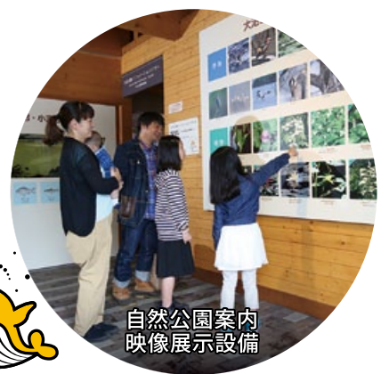
自然公園案内 映像展示設備