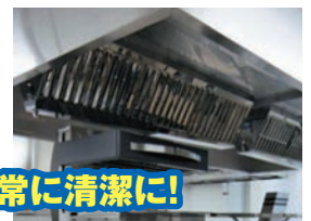
厨房設備は常に清潔に!

清掃、必要な点検及び整備など厨房設備の維持管理は「火災予防条例」で義務づけられています。